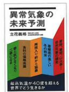
『異常気象の未来予測』 立花義裕 著（ポプラ社）