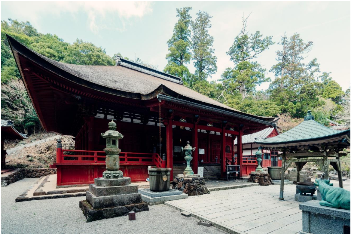
金剛證寺（こんごうしょうじ）〈三重県伊勢市〉